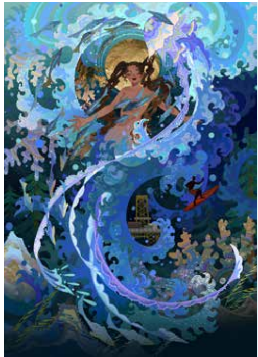
Havfruen blir et musikalsk eventyr for hele familien. Illustrasjon: Kuri Huang

Det er med andre ord gode, musikalske grunner til å samle storfamilien og se Havfruen denne høsten!